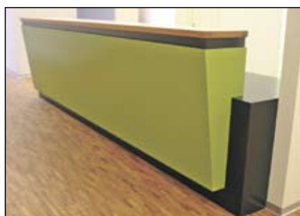
praxis15 AG, Burgdorf.