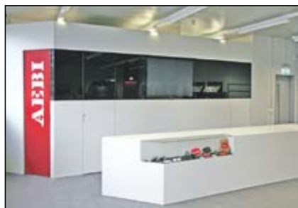
Aebi & Co. AG, Burgdorf.

Die Werthmüller Schreinerei AG hat in den letzten Jahren eine neue, spannende Spezialität entdeckt: sie baut Empfangstheken für Praxen, Firmen und Behörden