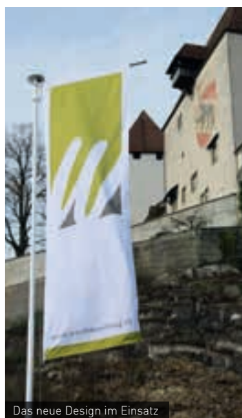
Das neue Design im Einsatz